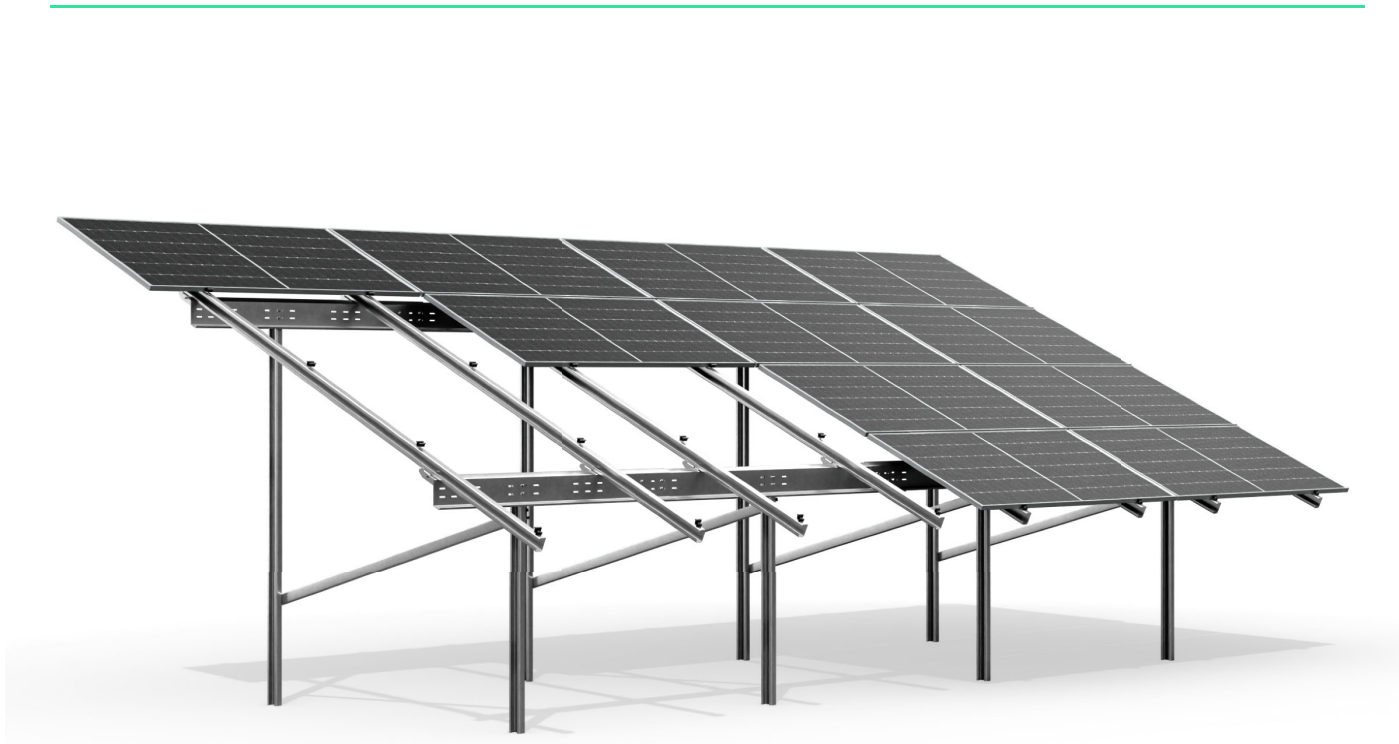
wizualizacja poglądowa sample image

czterorzędowa, monofacial, dwupodporowa four-row, monofacial, double support