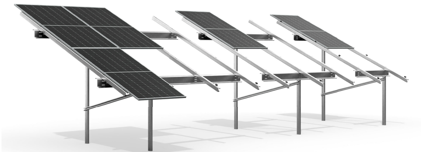
wizualizacja poglądowa sample image

dwurzędowa, bifacial, dwupodporowa two rows, bifacial, double support