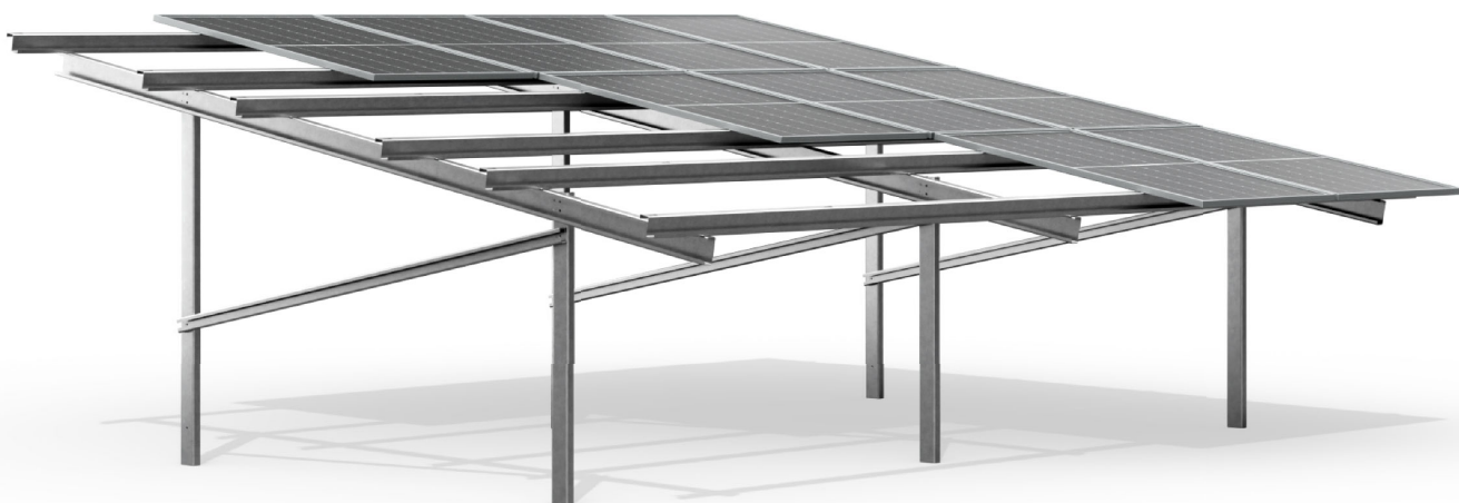
wizualizacja poglądowa sample image

trzyrzędowa, monofacial, dwupodporowa three-row, monofacial, double support