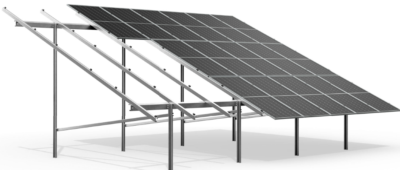
wizualizacja poglądowa sample image

trzyrzędowa, bifacial, dwupodporowa three-row, bifacial, double support