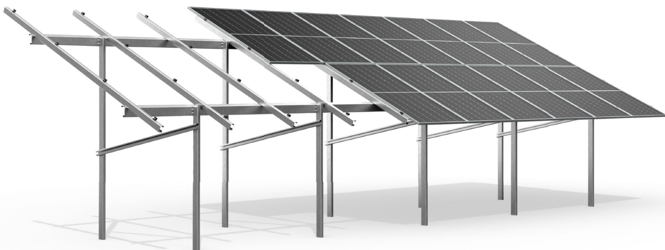
wizualizacja poglądowa sample image

dwurzędowa, bifacial, dwupodporowa two rows, bifacial, double support