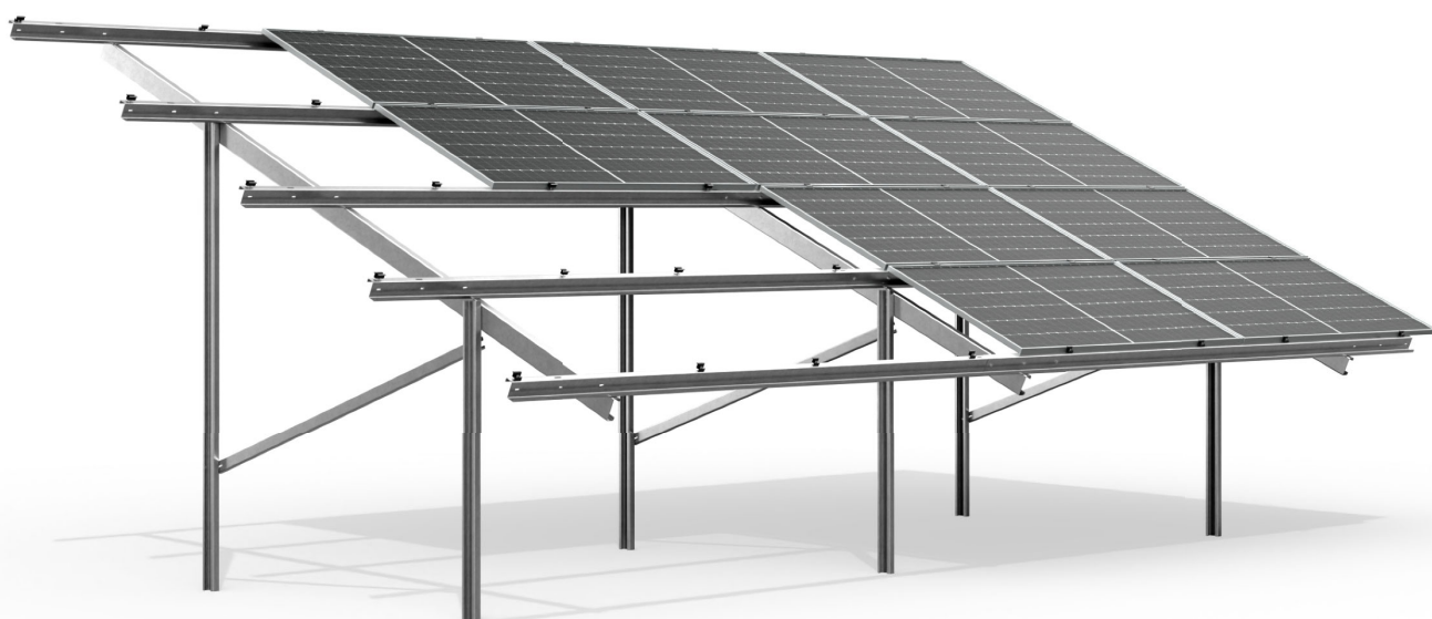
wizualizacja poglądowa sample image

czterorzędowa, bifacial, dwupodporowa four-row, bifacial, double support