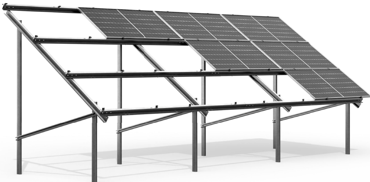
wizualizacja poglądowa sample image

trzyrzędowa, monofacial, dwupodporowa three-row, monofacial, double support